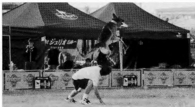
99年ジャパンファイナル

までは出来るトリックを並べただけ。このあたりは、ほとんどのトリックは出来るわけで、後はそれをどうゆう風に見せるかを考えるのが楽しかった。たとえば、バックボルトをカッコよく決めたいとする。ならばカッコよく見える流れを考える。スローで走らせて、スピードをつけてバカッと跳ばすか、それともショートマルチプルで細かく刻んで、突然ポンと跳ばすか、それとも犬をまたせて「さあ、やるぞ」とアピールして跳ばすか、いろいろと考えて試してみる。