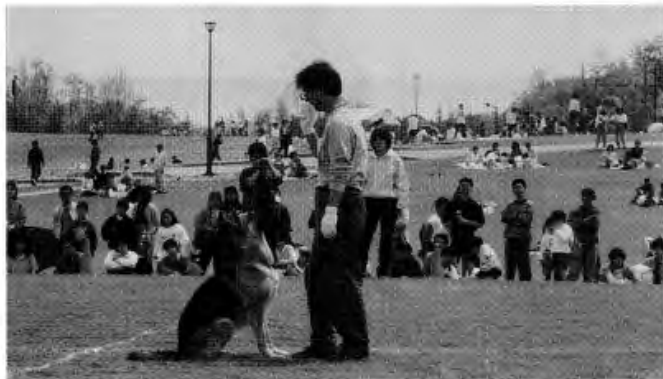
大会デビュー戦 95年5月広島

いい作品。つまり、いい演技とは高い次元で難しさ(アクロバチック性)、きれいな流れと美しさ(ストーリー性)、躍動感、演出、個性それと出来具合のバランスが取れていること。そしてもっとも大切なのが見ている人にそれが伝えられること。これはいくら