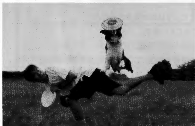
リバースレッグオーバー。

それでも研究に研究を重ね、練習に明け暮れ、キャリアが積み重なると不思議なもので出来ないことができるようになってくる。ここまで三年。このあたりが最初楽しめる時期。どんどん手持ちのトリックが増えていく。出来ないことが無いような気がしてくる。ただし、ルーティーン構成とかはムチャクチャ。ルーティーンを楽しめるようになったのはここ2、3年だ。それ